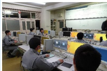
↑ CAD実習 ↓ 旋盤実習