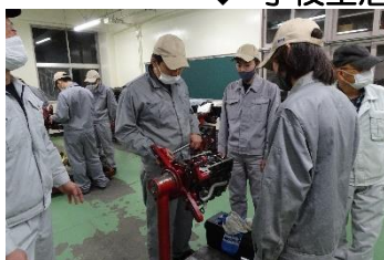
↑ 原動機実習 ↓ MC実習