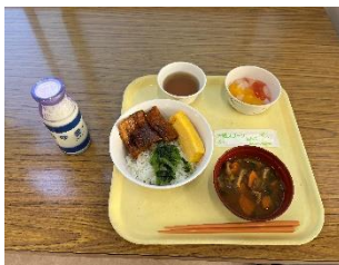
↓↓ 給食室と給食 ↑↑