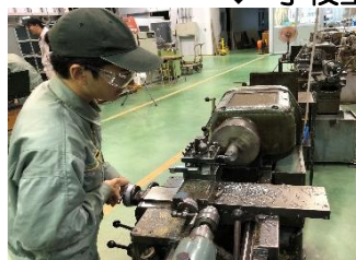
↑ 旋盤実習 ↓ フライス盤実習