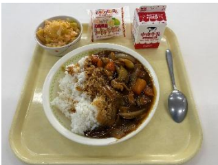
↓↓ 給食室と給食 ↑↑