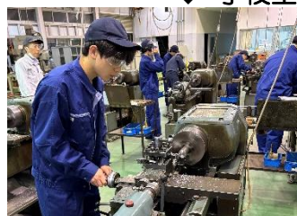
↑ 旋盤実習 ↓ MC 実習